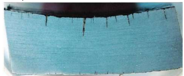
Grietas nucleadas en las superficies interna y externa de una conexión en T, debido a la fatiga, causada por la falta de flexibilidad en la tubería de vapor (vista ampliada de la pared de conexión en corte transversal).