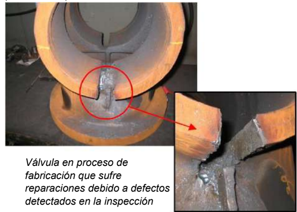
Válvula en proceso de fabricación que sufre reparaciones debido a defectos detectados en la inspección

En el caso de piezas fundidas, y un ejemplo típico para esto sería la fabricación de válvulas, las reparaciones de grietas inherentes al proceso de fundición demandan procedimientos y soldadores calificados para la soldadura de estos nuevos materiales, y esto ya no es tan simple como cuando se trabaja con acero al carbono. Además, estos fabricantes pasan necesariamente a tener que disponer de recursos para el acondicionamiento y el manejo adecuados de los consumibles de soldadura, además de equipos para permitir precalentamientos y alivio de tensiones de las piezas recuperadas.